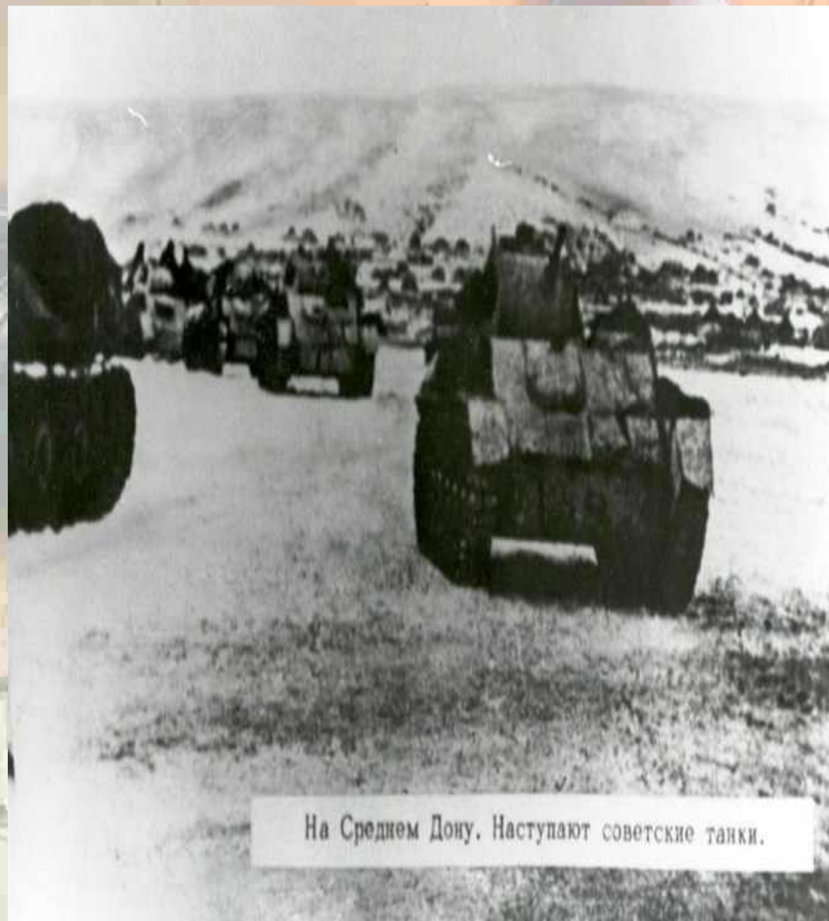
На Среднем Дону. Наступают советские танки.